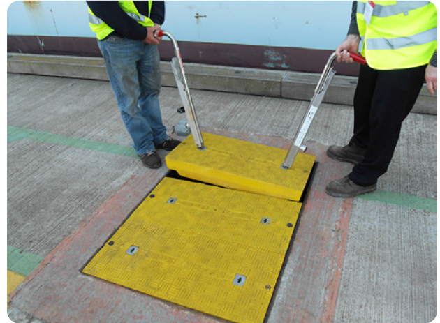
Retirada fácil y segura usando los bastones Fibrelite

Las tapas de sustitución que suministró Fibrelite fueron para carga F900 y de color amarillo para indicar el punto de agua potable. Como las autoridades regionales de suministro de agua habían especificado previamente que las tapas tenían que poderse bloquear y mantenerse cerradas con el fin de evitar accesos no autorizados, Fibrelite proporcionó una versión que se atornilla al marco existente.