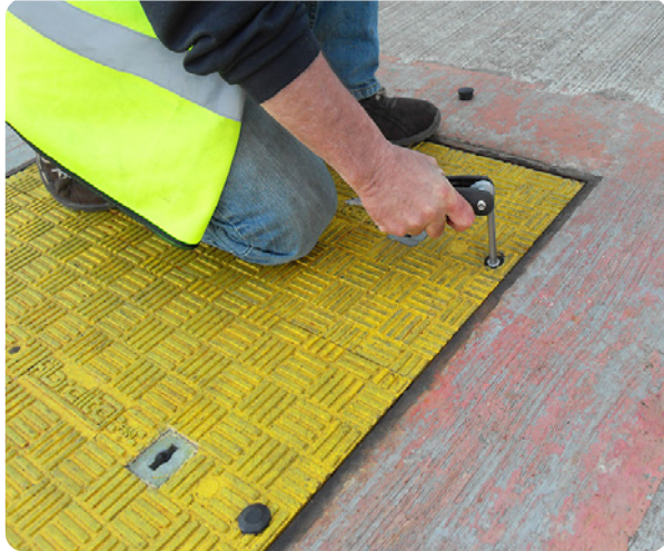
Operario quitando el sistema de bloqueo de Fibrelite