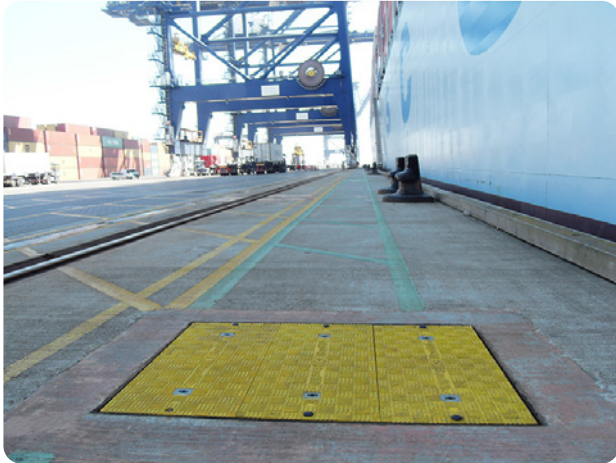
Paneles de peso liviano Fibrelite para carga de 90 toneladas instalados en el muelle

A Fibrelite se le encargó el suministro de tapas de peso liviano resistentes a 90 toneladas de carga para la sustitución de las antiguas, capaces de soportar el severo medioambiente de trabajo de un puerto comercial con una elevadísima actividad.